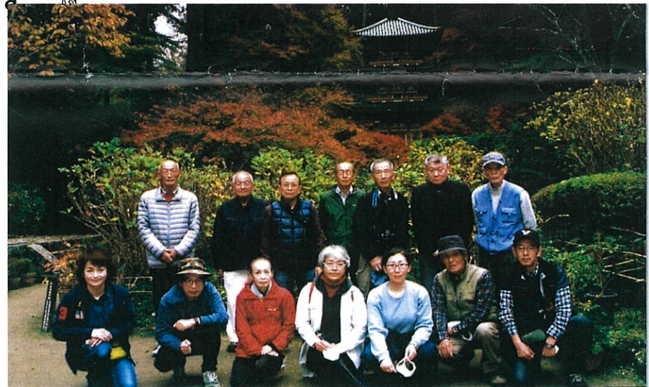
杉クラブ奈良撮影旅行 2020年11月22・23日

年一回、毎年7月に行なわれる「プラザおおるり」展示ホールでの写真展「遊迷展」も恒例となっています。